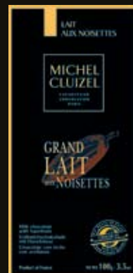
Tablettes traditionnelles 70 g